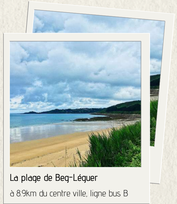
La plage de Beg-Léguer