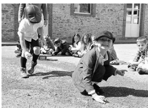
● Découverte de jeux d'antan