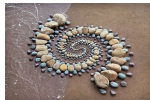
● Land Art