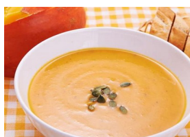
● Soupe au potiron